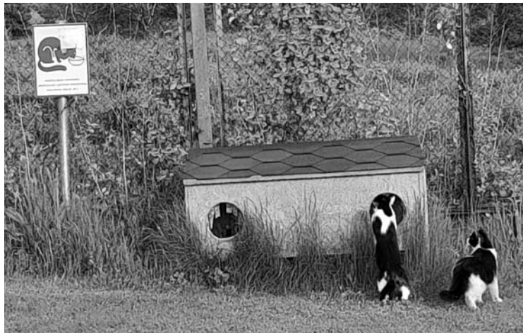
Anykščių rajono savivaldybė mieste įrengė keturias šeimininkų kačių šėrimo vietas. Viena jų – prie Anykščių ligoninės.

Pasirodo, toje teritorijoje besistiebiantis gražus, erdvus namelis, uždengtas stogu, yra Anykščių rajono savivaldybės administracijos patvirtinta šeimininkų kačių šėrimo vieta Nr. AK-2.