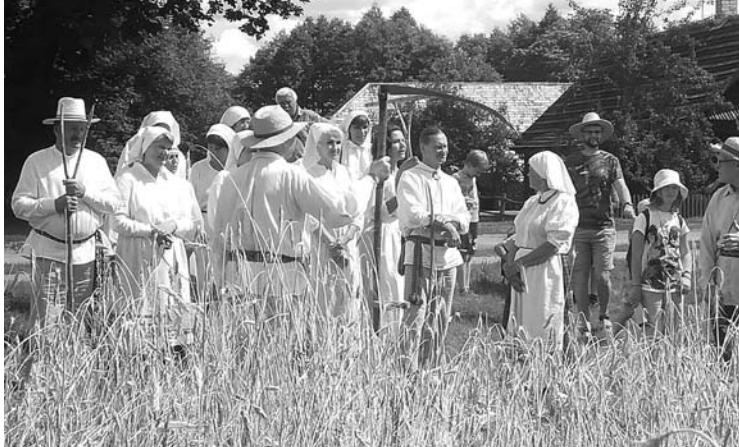
Rugiapjūtė - džiugi ir spalvinga šventė Arklio muziejuje Niūronyse.

Šeštadienį Arklio muziejuje vyko edukacinė rugiapjūtės šventė, į kurią suplaukė didelis pulkas žmonių.