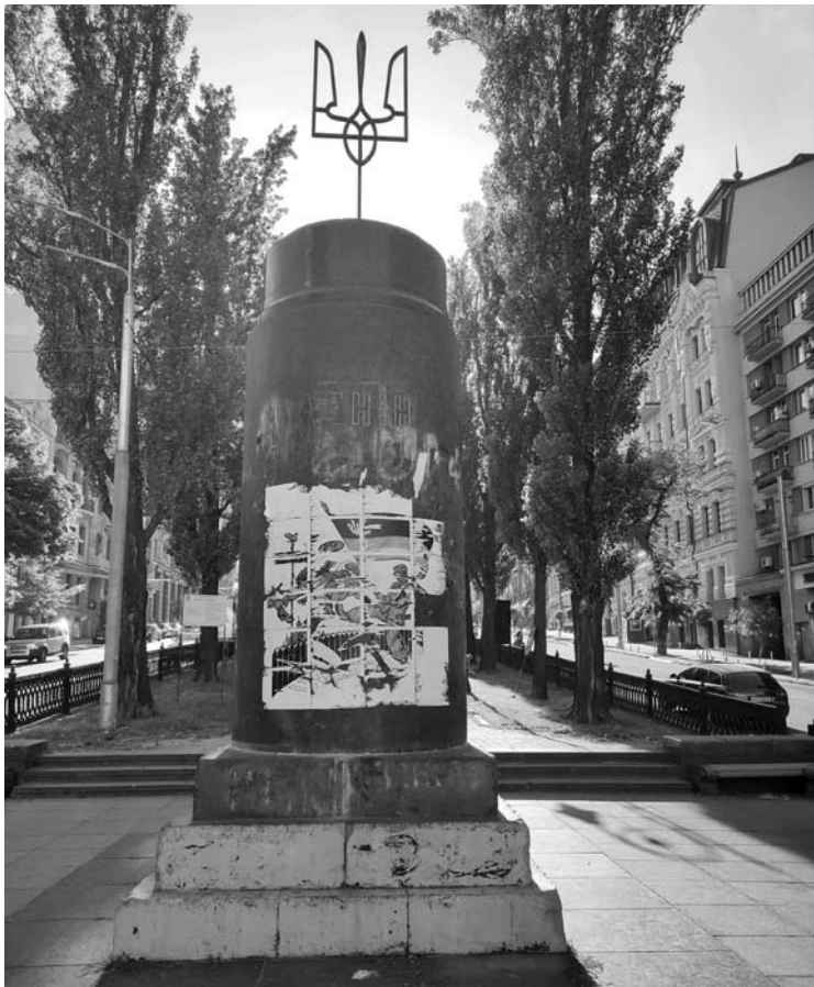
Kijevo centre tebesipuikuoja paminklas su užrašu Leninas.

Tiesa, šio Rusijos revoliucijos vado, į Kremliaus gniaužtus Ukrainą atvedusio dar 1922 metais, statula Kijeve buvo nuversta 2013 metais. Nuvertę pačiame miesto centre stovėjusį paminklą, kijeviečiai paliko aukštą apvalų granitinį postamentą, ant kurio ir toliau puikuoja užrašas – Leninas.