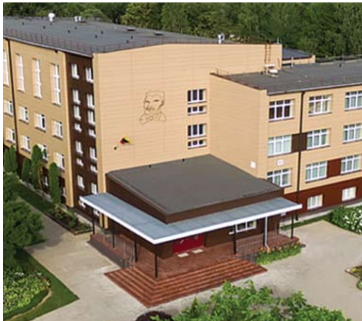
Anykščių Jono Biliūno gimnazija liks vienintelė gimnazija rajone.