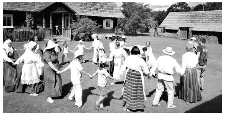
Smagus ratavimas etnografinės Arklio muziejaus sodybos kiemelyje.

Žmonės mokėjo iškalti dalgį, pasiruošti grėbliuką ar lankelį -